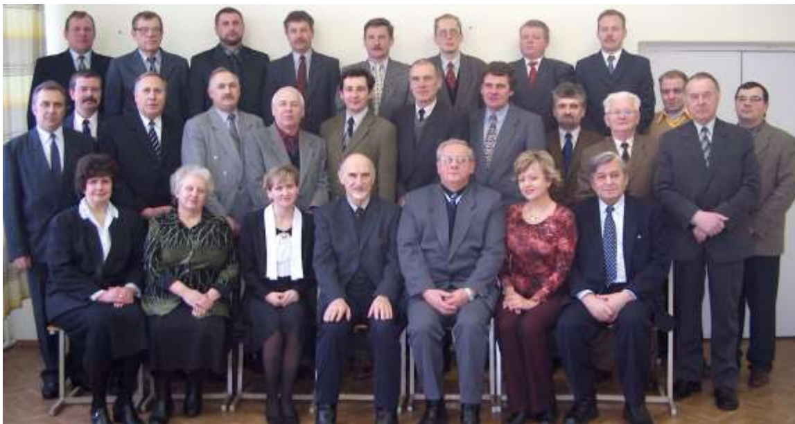
2 pav. Profesinės saugos ir inžinerijos vadybos katedros darbuotojai, 2004 m.