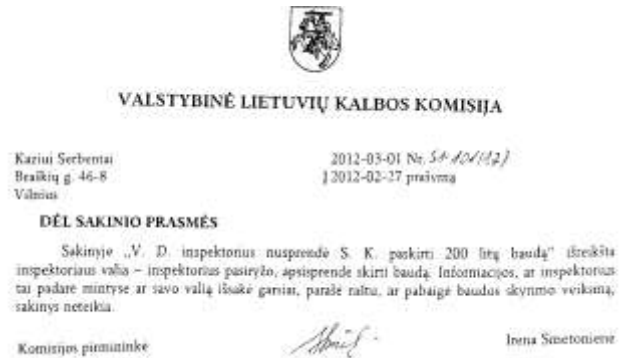
2 pav. Valstybinės lietuvių kalbos komisijos išaiškinimas dėl inspektoriaus sprendimo skirti baudą

Siekdami objektyvumo ir pagrįstumo, pateikiame konkrečių dokumentų ištraukų pavyzdžius (žr. 2 ir 3 pav.).