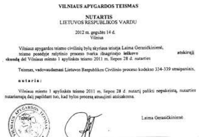
3 pav. Vilniaus apygardos teismo nutarties ištrauka su kalbos ir logikos klaidomis