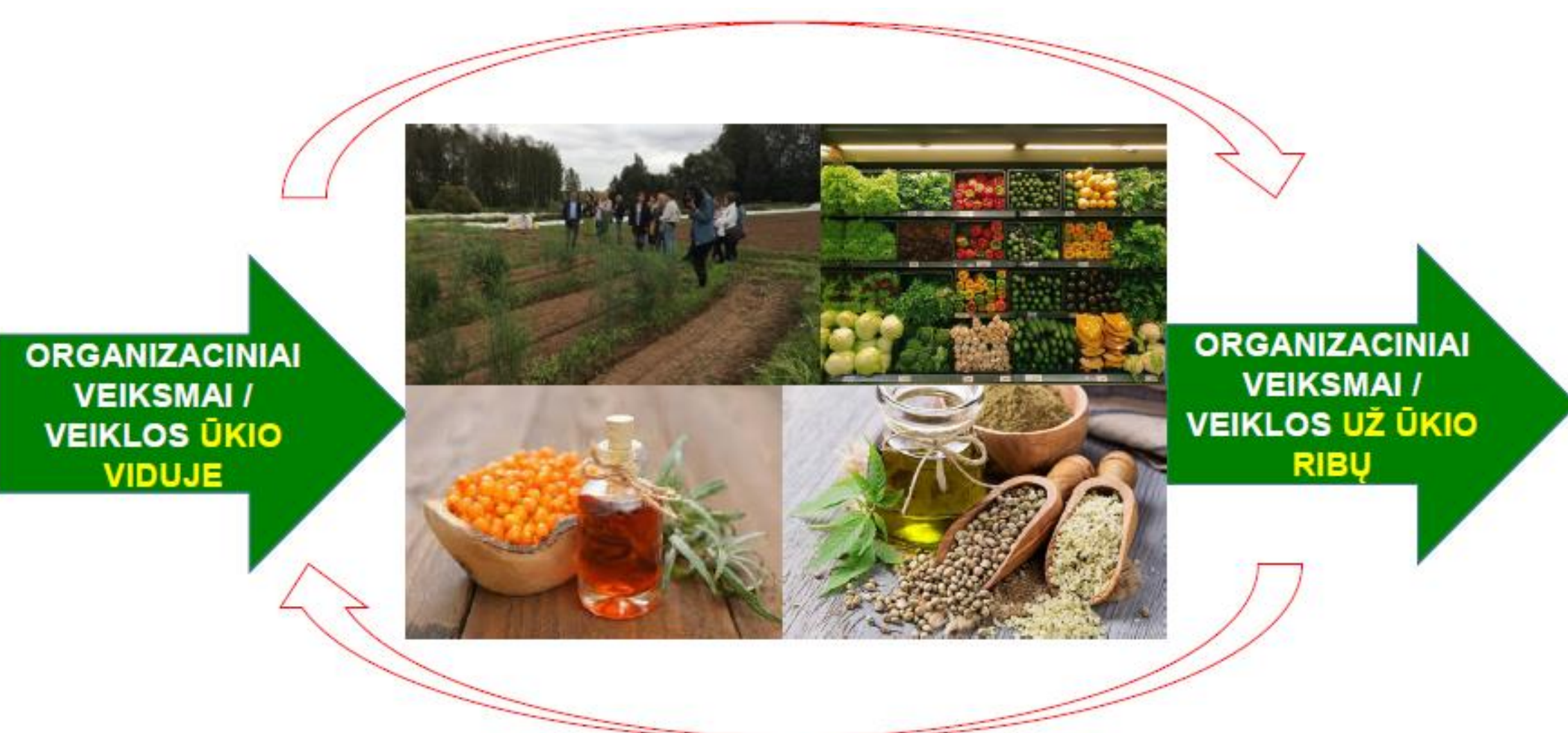
4 pav. Organizaciniai vidiniai ir išoriniai TMTG veikimai